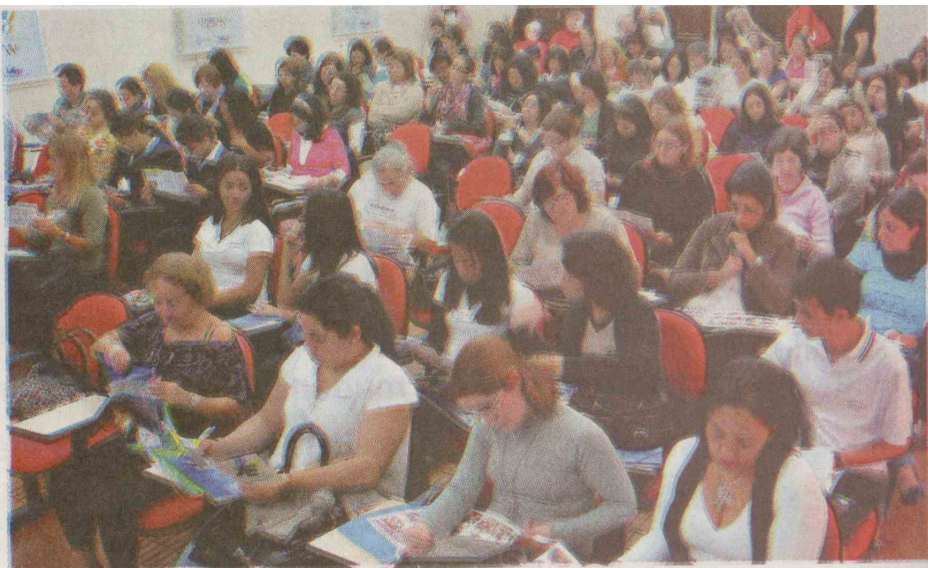
Mais de 100 educadores se reuniram para compartilhar experiências com o uso do jornal

Arrecadação de alimentos para entidades carentes mobilizou os jovens do Centro de Aprendizagem Metódica e Profissional (CAMP), de São Vicente. Na Unidade Municipal de Ensino Padre Lúcio Floro, de Santos, as crianças de Edu-