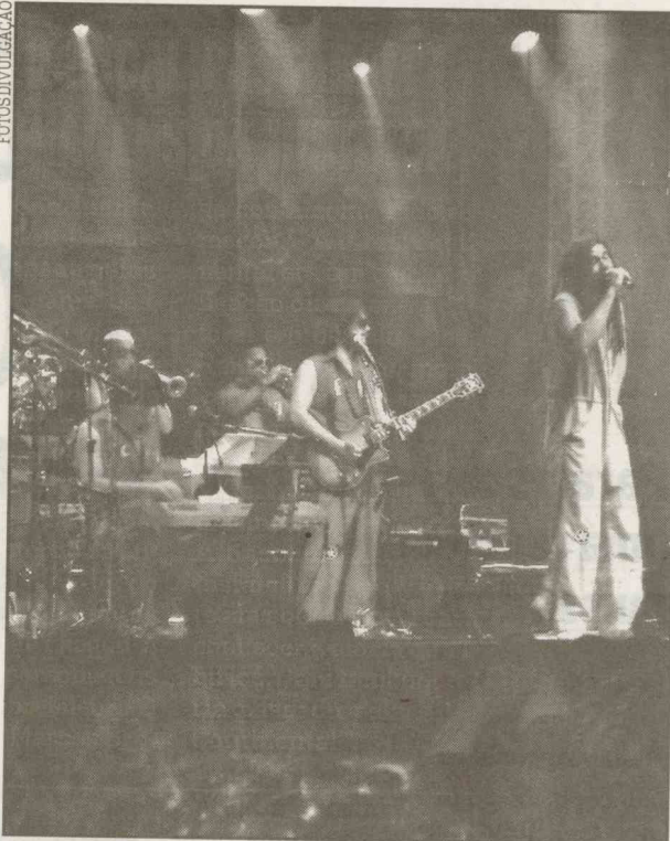
O Funk Como Le Gusta faz show em Guarujá no feriadão

ra, na Praia da Enseada, próximo ao Centro. Eles chegarão à Cidade e farão passeio pelas principais ruas. Também farão visita à feira de artesanato, que fica no Centro de Bertioiga.