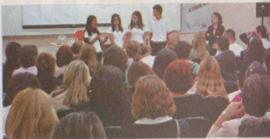
Unidades selecionadas para apresentar trabalhos deram lição de cidadania

cação Infantil e do 1º Ciclo do Ensino Fundamental descobriram a importância de evitar acidentes domésticos. Os jovens do Centro de Formação Profissional - CAMP Guarujá e da Escola Estadual Professor René Rodrigues de Moraes, também de Guarujá, presen-