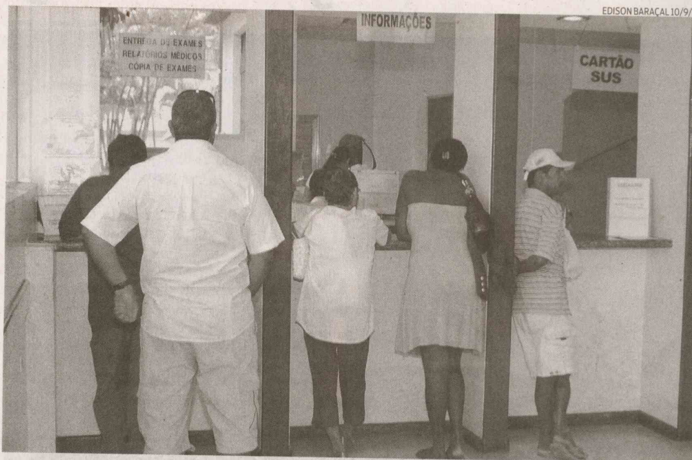
Pacientes do SUS também dependem do Hospital Santo Amaro para atendimentos ambulatoriais

“Guarujá é a terceira maior cidade do Litoral Paulista, mas dispõe de apenas